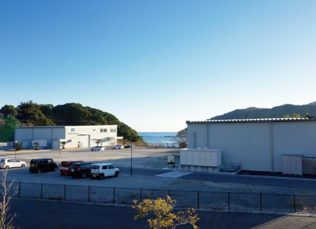
リサーチセンター(左)ができた翌年にはエアバッグの部品を作る工場(右)も新設。今年夏にはさらに第2工場も増設され、長崎はカネミツの新たな生産拠点になりつつあります。

製品開発の前段階である基礎研究は、自前で丸抱えするよりも大学など外部機関と共同する方が可能性も広がります。カネミツの本社は兵庫県ですが、長崎市にリサーチセンターを設立したことで、研究者と現場担当者が顔を合わせて打ち合わせがしやすくなり、研究のスピードも加速しました。