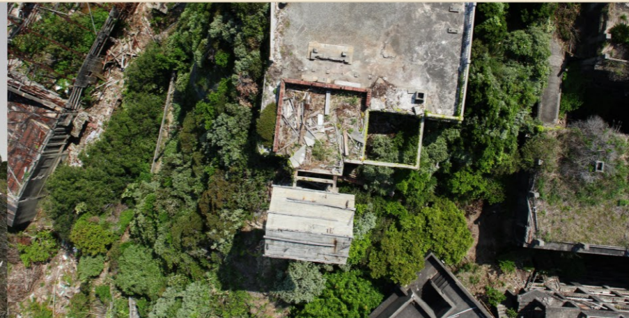
上空からドローンが撮影した画像。上と右は軍艦島。