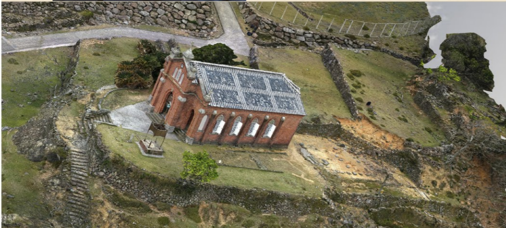
旧野首教会堂。周辺の石垣も貴重な遺産です。