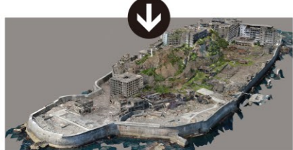
デジタル画像を貼ることで本物そっくりに。