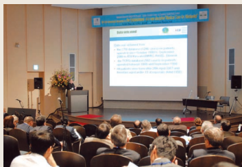
シンポジウム風景(1)

医歯薬学総合研究科は、1月31日～2月2日、4日の4日間、長崎大学グローバルCOEプログラム「放射線健康リスク制御国際戦略拠点」(CHOOH0第21号参照)の第1回国際シンポジウムを医学部良順会館において開催しました。