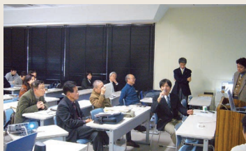
質問に答えるWWFジャパン小森氏