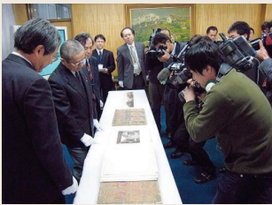
140年ぶりの里帰りに殺到する報道陣

附属図書館が過去20年間にわたって収集してきた「幕末・明治期日本古写真コレクション」( http://www.lib.nagasaki-u.ac.jp/old_pic/ )のなかでも中核的な資料になるものと期待されており、平成20年秋には展覧会を実施した後、インターネットで広く公開する予定です。