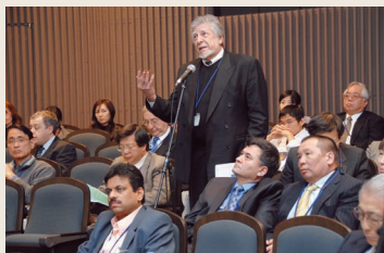
シンポジウム風景(2)