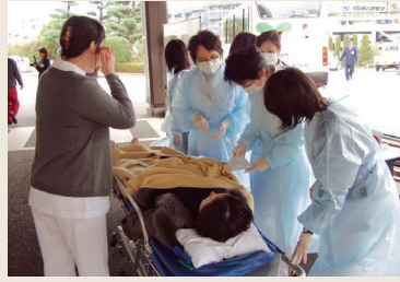
搬送された傷病者のトリアージを行う医師等

救急車等で搬送されてきた傷病者を、傷病度が軽い順に緑、黄、赤、黒の4段階に色分け（トリアージ）し、治療の優先順位を決め、それぞれの色のエリアに搬送し、治療する訓練を行いました。 今回の地震災害医療訓練は、参加者が各エリアでの役割、連絡体制などを確認し、意義のある訓練となりました。