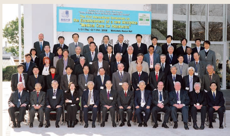
国内外招待者による記念撮影

今回のシンポジウムは、「新学際領域『被ばく医療学』の教育・研究拠点形成に向けて」のテーマで、今後の年次活動の目標と将来計画を明示し、活動内容を国内、旧ソ連邦、アメリカ、ヨーロッパの共同研究機関の研究者と協議するため開催されたもので、海外の研究者20名を含む放射線疫学、被ばく者医療、及び放射線生物学の著名な専門家42名が招聘され、総勢130名を超える研究者が参加し、基調講演や研究発表が行われ、大きな成果をあげました。