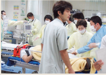
赤エリアで受入の様子

11月20日、医学部・歯学部附属病院は長崎市消防局の協力を得て、職員、医学部学生等約130名が参加し、長崎市周辺で震度6弱の地震が発生したことを想定して、地震災害医療訓練を行いました。